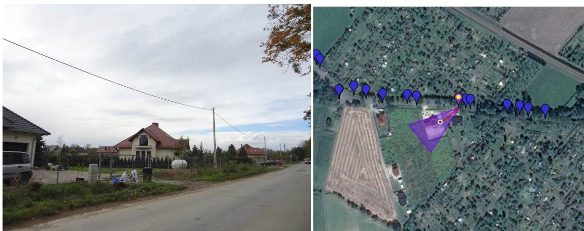
Fot. 5. Zabudowa mieszkaniowa jednorodzinna [obok lokalizacja i kierunek wykonania zdjęcia].

Analiza aktualnego zagospodarowania przestrzennego obszaru opracowania nie wskazuje na możliwość istotnych zmian środowiska przyrodniczego w razie nierealizowania planu miejscowego. Zaniechanie realizacji mpzp nie spowoduje istotnych pozytywnych zmian w środowisku, które mogłyby stanowić uzasadnienie