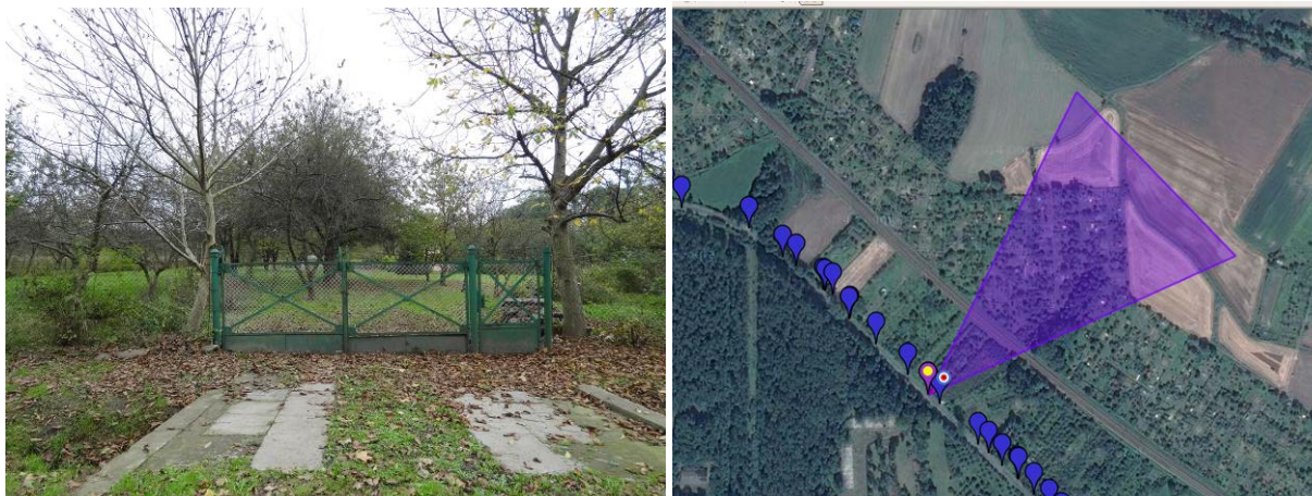
Fot. 3. Sady po północno-wschodniej stronie ul. Małujowickiej [obok lokalizacja i kierunek wykonania zdjęcia].

Prognoza oddziaływania na środowisko zmiany miejscowego planu zagospodarowania przestrzennego miasta Brzeg dla obszaru rejonu ul. Małujowickiej, t.j. obszaru ograniczonego od zachodu i północnego zachodu granicą miasta, od północnego wschodu magistralną linią kolejową, od południowego wschodu terenami kolejowymi i od południa granicą miasta