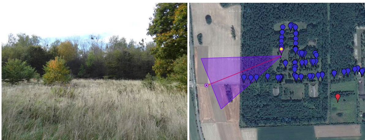
Fot. 2. Zadrzewienia na terenach wojskowych [obok lokalizacja i kierunek wykonania zdjęcia].