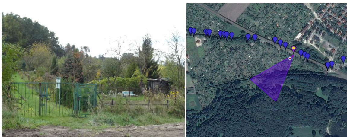
Fot. 4. Ogrody działkowe we wschodniej części [obok lokalizacja i kierunek wykonania zdjęcia].