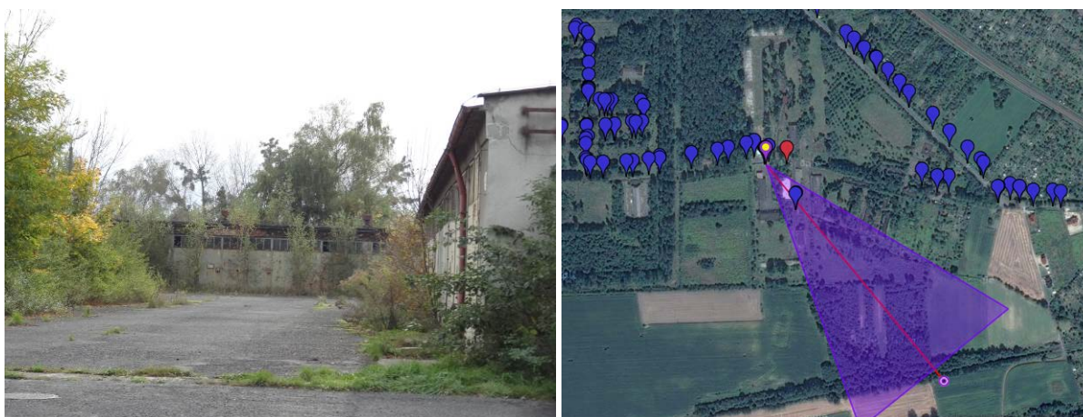
Fot. 1. Zabudowa terenów wojskowych [obok lokalizacja i kierunek wykonania zdjęcia].

Na obszarze opracowania nie występują obiekty i obszary zabytkowe.