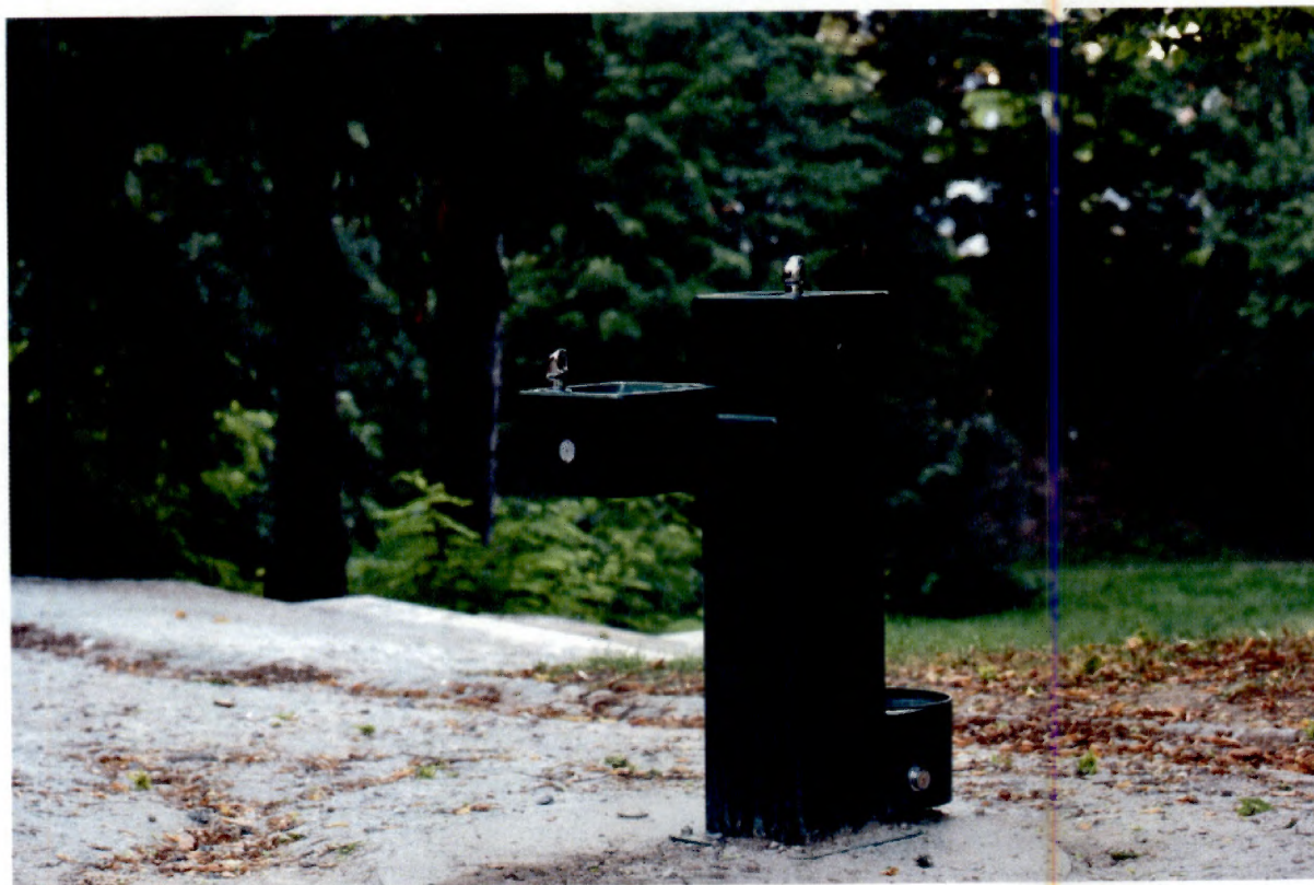
Zdrój wody pitnej w Parku Centralnym zrealizowany w ramach Projektu RPO