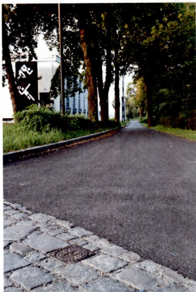
Wodociąg do budynków ul. Oławska 2-4 wraz z przyłączami (rurociąg z żeliwa sferoidalnego)