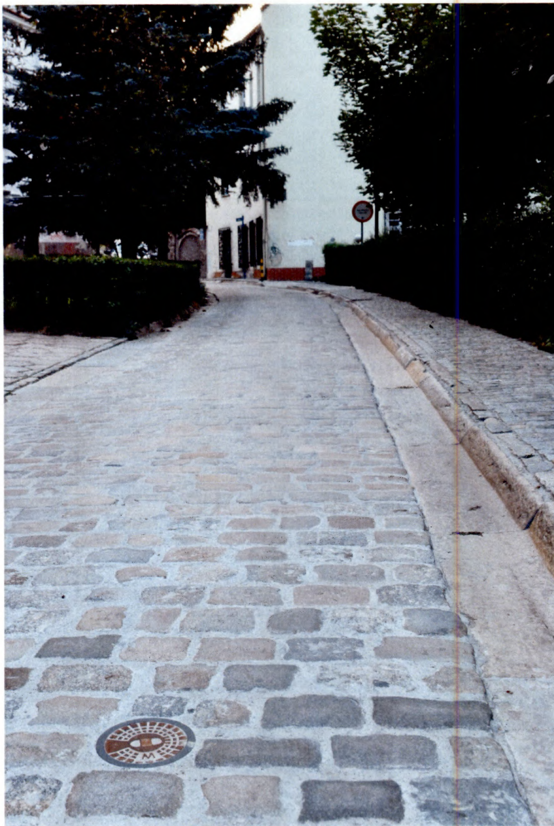
Wymieniony wodociąg ul. Pańska w Brzegu